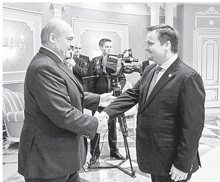
На встрече в Минске губернатор Новгородской области Андрей Никитин и Президент Республики Беларусь Александр Лукашенко обсудили вопросы укрепления двусторонних отношений

Кроме того, в рамках поездки глава региона обсудил с руководством Минского автомобиль-