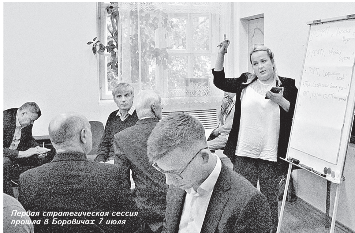
Первая стратегическая сессия прошла в Боровичах 7 июля