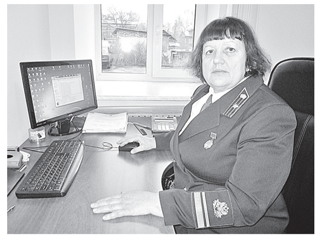
Современный лесник должен не только обходить лесные участки, но и дружить с компьютером